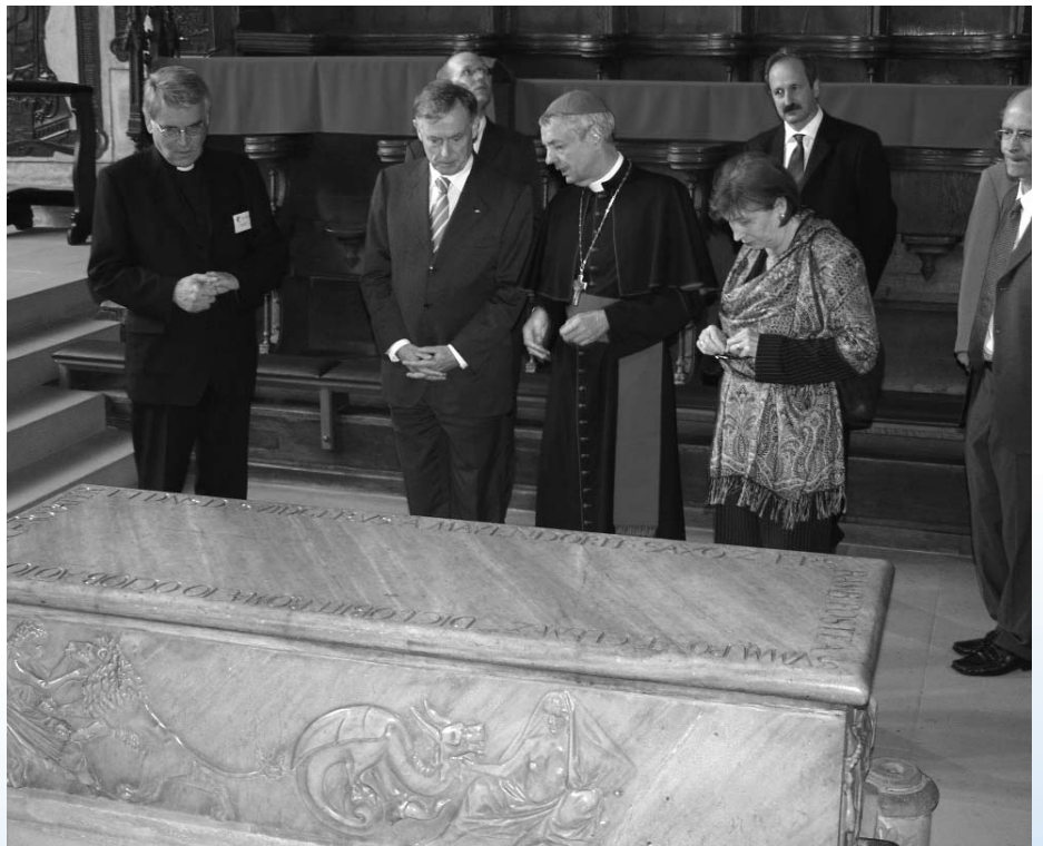
Auch Bundespräsident Horst Köhler besuchte Bamberg aus Anlass des Bistumsjubiläums. Im Dom ließ er sich von Erzbischof Dr. Ludwig Schick das Grab Papst Clemens' II. zeigen. links Domkapitular Prälat Luidgar Göller, der Geistliche Beirat des KKV Bamberg.