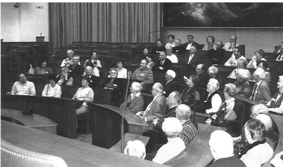
Die KKV-Mitglieder auf den Abgeordnetenplätzen des Maximilianeums.