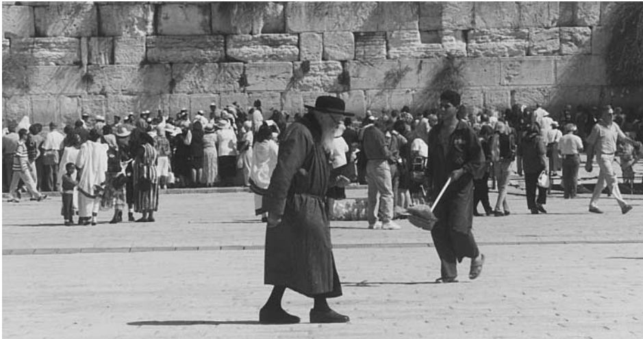
Jerusalem: Die Klagemauer ist alles, was vom Tempel des Herodes noch erhalten ist.