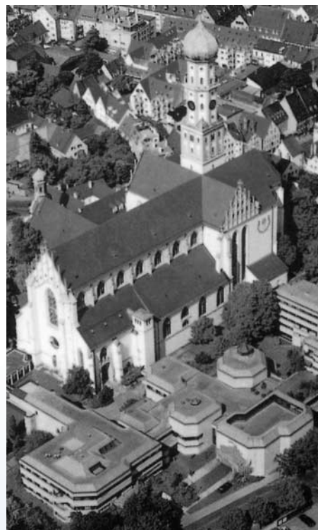
Das Haus St. Ulrich in Augsburg war Tagungsort des BWB-Adventstreffens 2002 (vorne). Dahinter erhebt sich die Basilika St. Ulrich und Afra.